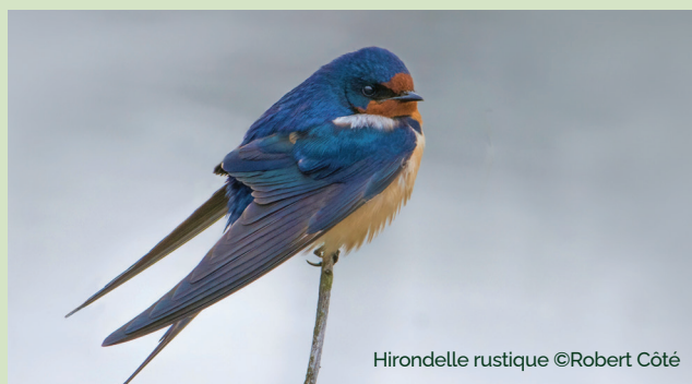
Hirondelle rustique

La propriété renferme des milieux forestiers, aquatiques et humides. Elle représente un maillon essentiel au maintien de la connectivité écologique entre le Parc national du Mont-Orford et les collines montérégiennes. Cette connectivité écologique est particulièrement favorable au mouvement de grandes espèces fauniques telles que l'orignal ou l'ours noir. D'autre part, sa protection est bénéfique pour des espèces vulnérables, y compris des amphibiens tels que la salamandre sombre du Nord, la salamandre pourpre et la salamandre à quatre orteils, plusieurs espèces de chauves-souris, ainsi que des oiseaux en déclin comme le pioui de l'Est et l'hirondelle rustique.