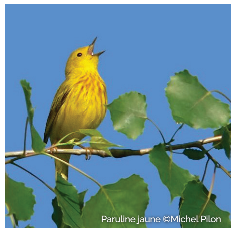
Paruline jaune