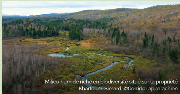
Milieu humide riche en biodiversité situé sur la propriété Khartoum-Simard.

En mai 2021, Corridor appalachien a annoncé la protection à perpétuité d'un ambitieux projet de conservation : l'aire protégée Khartoum-Simard de 442 ha .