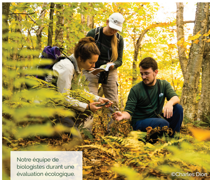
Notre équipe de biologistes durant une évaluation écologique.

En près de vingt ans, Corridor appalachien a généré une grande quantité et qualité de données sur les espèces et les habitats de son territoire d'action. Par l'entremise d'ententes avec les divers palliers gouvernementaux, des partenaires de conservation et même des groupes de recherche universitaire, nous partageons nos données sur les milieux naturels de la région afin de contribuer à l'avancement des connaissances collectives face à divers enjeux environnementaux et de rétablissement d'espèces en situation précaire.