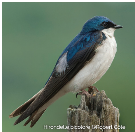
Hirondelle bicolor

longtemps dans la région. On note aussi un retour hâtif au printemps chez certains individus, phénomène qui serait lié aux températures douces, qui se manifestent un peu plus longtemps également. Ces changements dans leurs habitudes migratoires seraient liés aux modifications apportées par les changements climatiques.