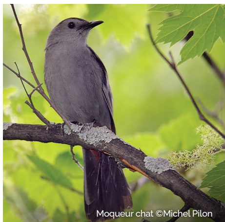
Moqueur chat