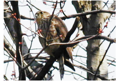
Buse à épaulettes