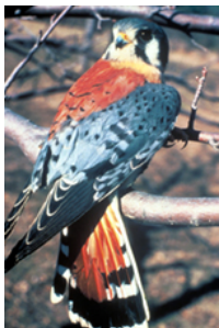
Crécerelle d'Amérique