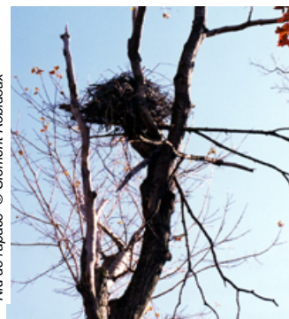
Nid de rapace

Plusieurs espèces de rapaces ont été décimées par l'utilisation des pesticides entre 1950 et 1980. Depuis l'application de nouvelles normes réglementant l'utilisation de ces produits, on assiste à une augmentation du nombre d'individus. La principale menace qui guette maintenant ces oiseaux est la perte et la destruction de leur habitat. La région des monts Sutton présente une impressionnante mosaïque de milieux dont on doit tenter de respecter l'intégrité. En diminuant la superficie des plantations et en conservant des boisés diversifiés, les propriétaires peuvent assurer de bonnes conditions à beaucoup de rapaces.