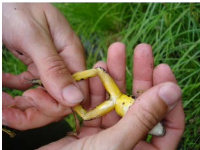
Grenouille des marais

La grenouille des marais est surtout terrestre, mais ne s'éloigne jamais beaucoup des plans d'eau ou des milieux humides, qu'ils soient ruisseaux, tourbières, étangs, lacs ou rivières. Elle se nourrit de petits invertébrés divers, d'insectes et d'araignées. Cet anoure est plutôt retrouvé en terrains montagneux et accidentés, ce qui limite ses déplacements. Pendant la saison hivernale, la grenouille des marais se terre dans la vase au fond des étangs et cours d'eau de faible profondeur et tombe en hibernation, période pendant laquelle elle ne respirera que par la peau. La grenouille des marais se reproduit en mai et juin, en milieu aquatique. Les œufs, se fixant à la végétation, éclosent de 4 à 21 jours après la ponte. La métamorphose des têtards a lieu en août et en septembre.