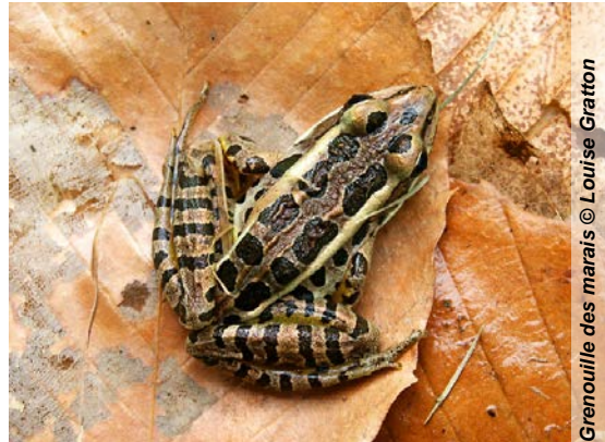
Grenouille des marais © Louise Gratton

La grenouille des marais ressemble beaucoup à la grenouille léopard, de laquelle on peut la distinguer par ses deux rangées de taches de forme rectangulaire sur le dos et sur les flancs, ainsi que par ses cuisses et ses aines de couleur jaune vif ou orangé. Aussi, la grenouille des marais ne dépasse guère 9 cm, tandis que la grenouille léopard mesure au maximum 11 cm. Lithobates palustris , à l'instar d'autres anoures, sécrète des substances nocives pouvant dissuader certains prédateurs.